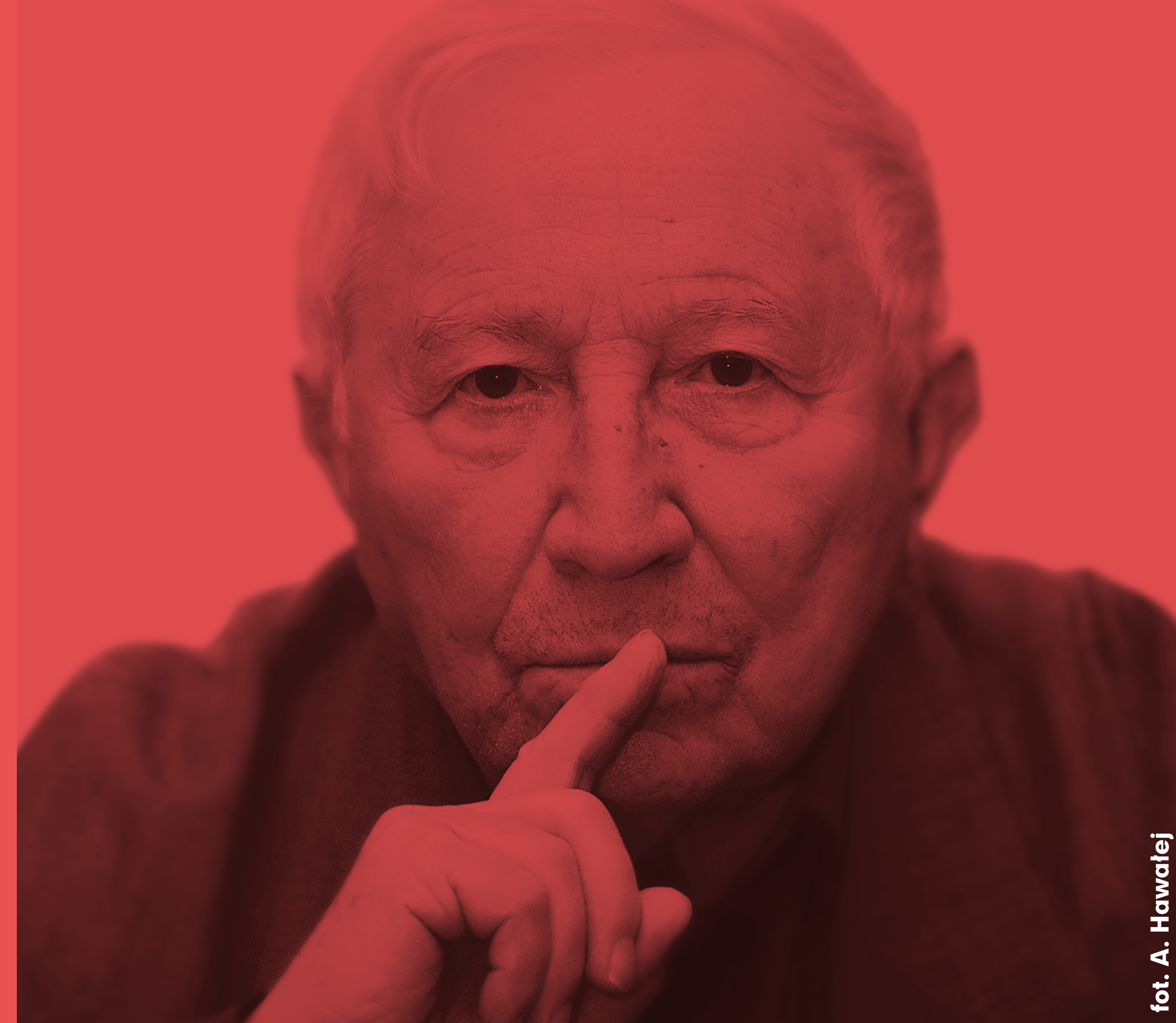
fol. A. Hawalej